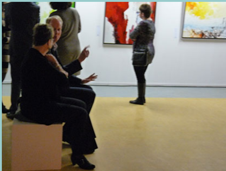
Met het bedrijf naar kunst (leren) kijken

Creatief als TERRA is, kan het bijna niet anders dan dat er invulling kan worden gegeven aan uw artistieke idee. Neem vrijblijvend contact op met TERRA via info@terra-artprojects.com .