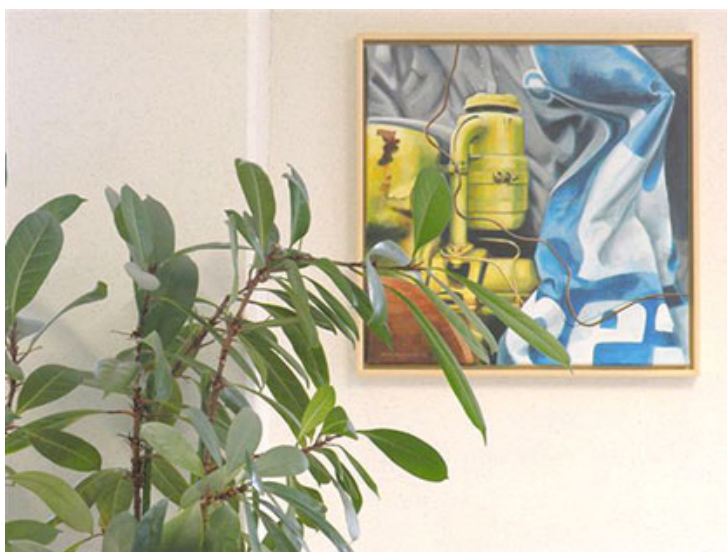
Werk van John Henniger via TERRA IN BEDRIJF

Tip: laat uw team zelf kiezen welke kunst er in uw bedrijf komt te hangen voor het meest gunstige effect. Creatief als TERRA is, kan het bijna niet anders dat er invulling kan worden gegeven aan uw artistieke idee. Neem vrijblijvend contact op met TERRA via info@terra-artprojects.com .