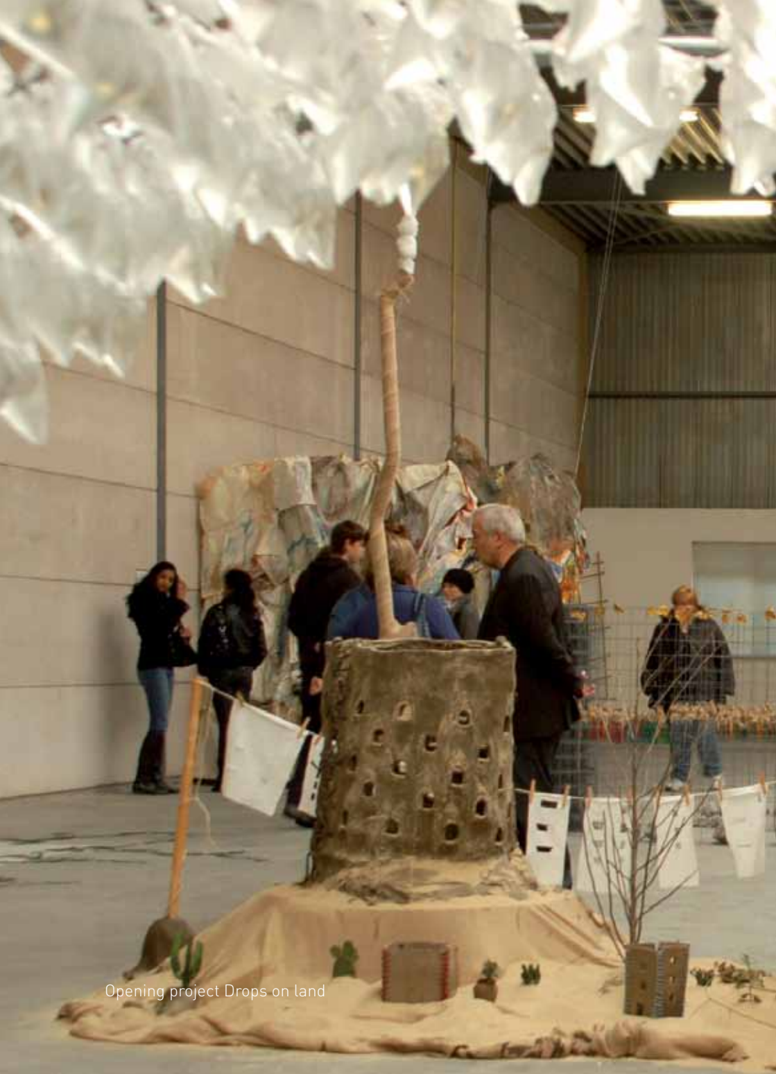
Opening project Drops on land

Drops on Land is meervoudig op te vatten. Enerzijds 'druppels op land' anderzijds de 'strijd tussen land en water, de strijd om land'. Deze overeenkomsten zijn het uitgangspunt voor dit project.