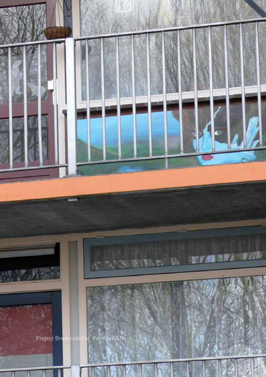
Project Braderodeflat, ParticipARTE