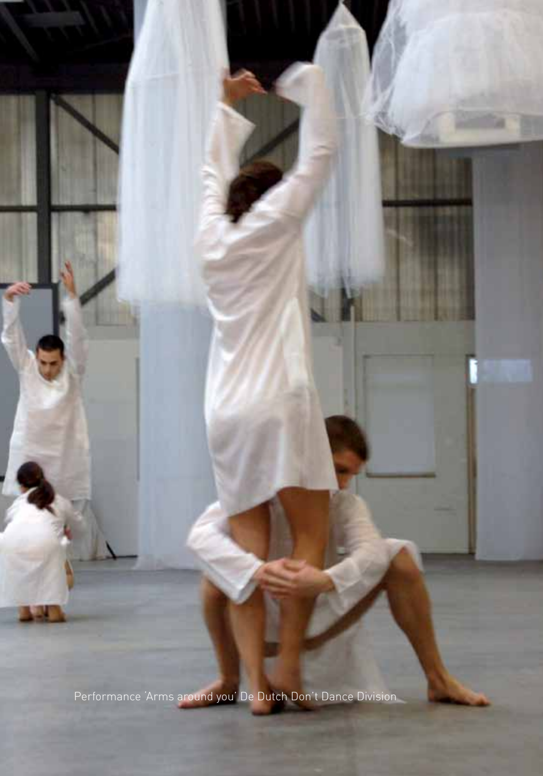
Performance 'Arms around you' De Dutch Don't Dance Division