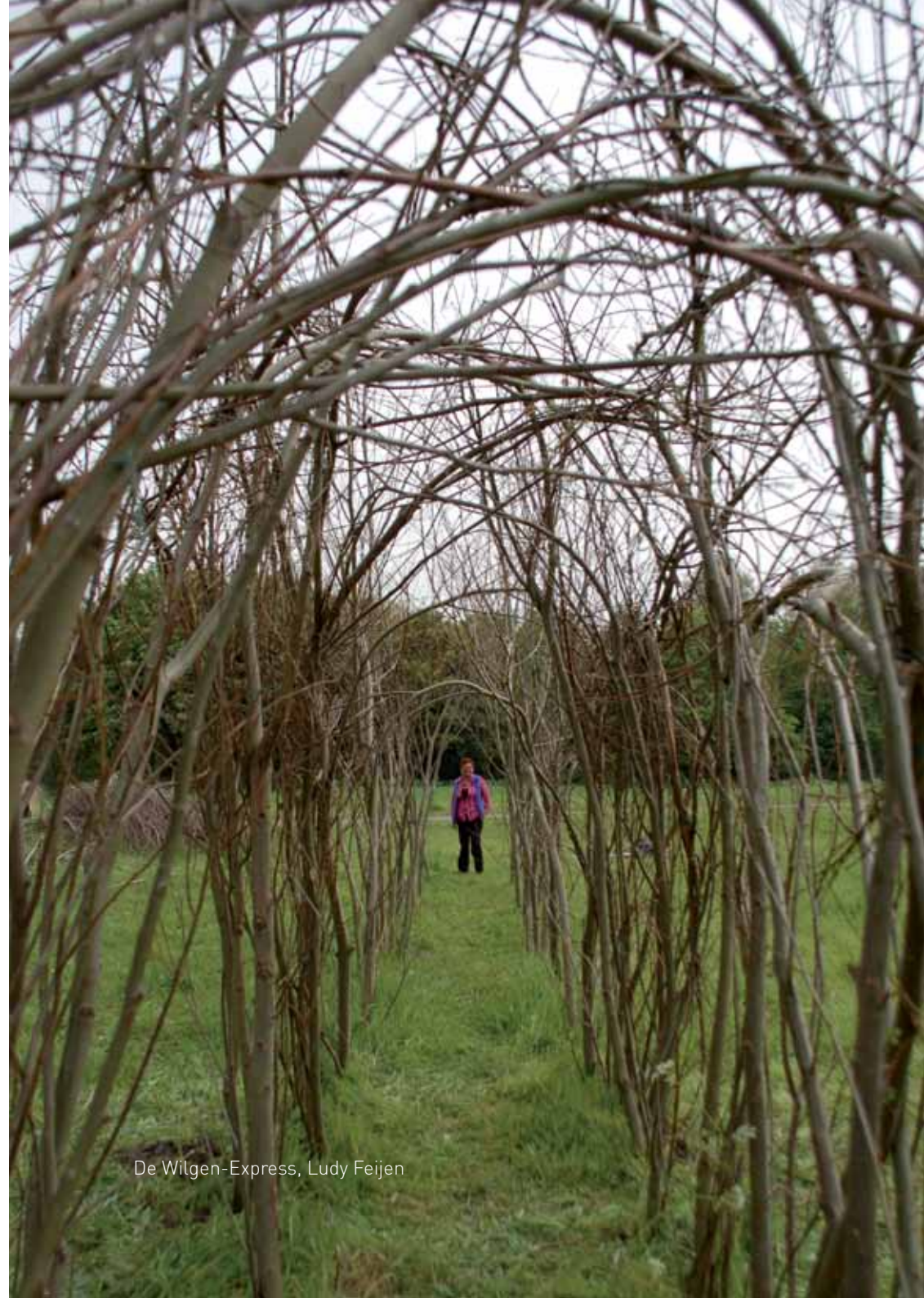
De Wilgen-Express, Ludy Feijen

Eind 2009 werd Terra Art Projects door de afdeling stadswerken van de gemeente Zoetermeer benaderd om een bijdrage te leveren aan de