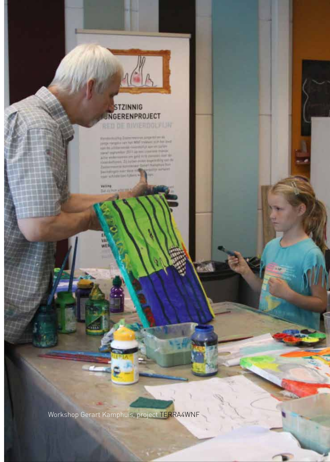
Workshop Gerart Kamphuis, project TERRA4WNF

Het programma van de kunstfoyers is door de programmacommissie geëvalueerd, waarbij is geconstateerd dat het aantal bezoekers niet aan de verwachtingen voldoet. Er is dan ook aan het management van het projectbureau voorgesteld om de presentaties van de exposanten niet meer op een afzonderlijke avond te laten plaatsvinden maar deze voor de opening van de tentoonstelling te plannen en daarnaast om de themabijeenkomsten op zondagen te organiseren.