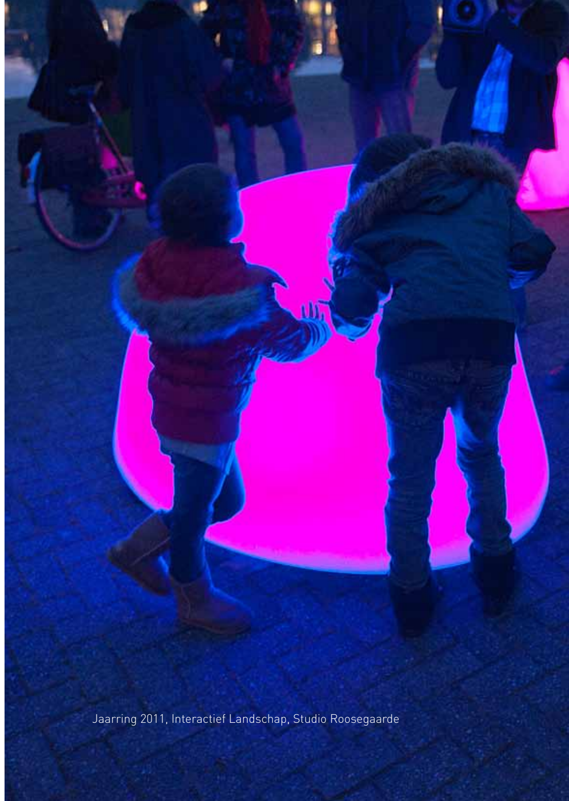
Jaarring 2011, Interactief Landschap, Studio Roosegaarde