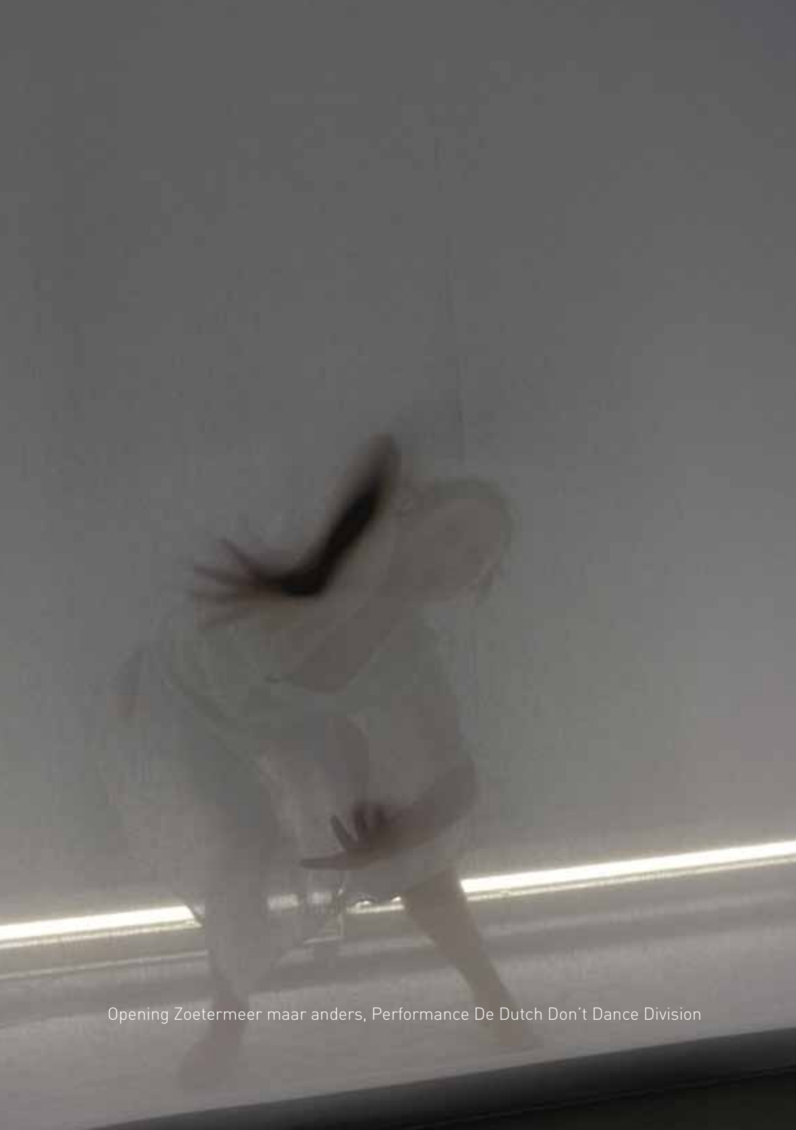
Opening Zoetermeer maar anders, Performance De Dutch Don't Dance Division

Door kritisch te blijven wordt doorlopend geprobeerd een nog stevigere verankering te verkrijgen voor Terra Art Projects en haar projecten. De meningen van bezoekers, participanten, passanten, stakeholders, vrijwilligers, de eigen organisatie en kunstenaars dragen bij aan een continue ontwikkeling van het aanbod.