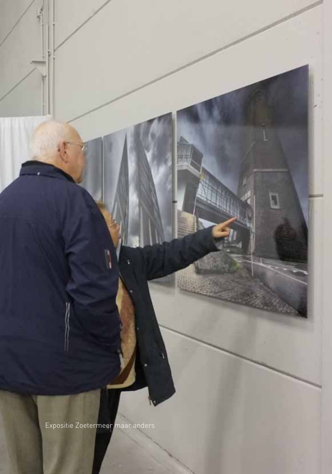
Expositie Zoetermeer maar anders