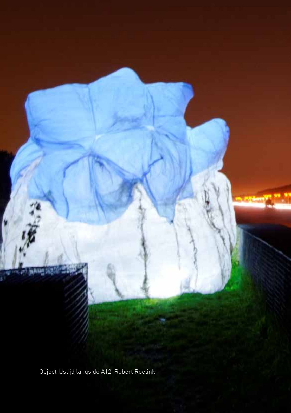
Object IJstijd langs de A12, Robert Roelink

De uitwisseling zal niet alleen doorwerken in het persoonlijke oeuvre maar ook zal de nieuwverworven en toegevoegde kennis gedeeld worden met Chinese studenten.