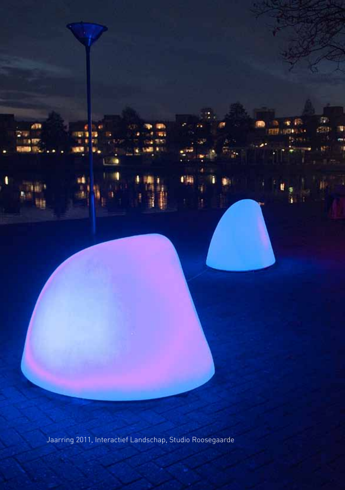
Jaarring 2011, Interactief Landschap, Studio Roosegaarde