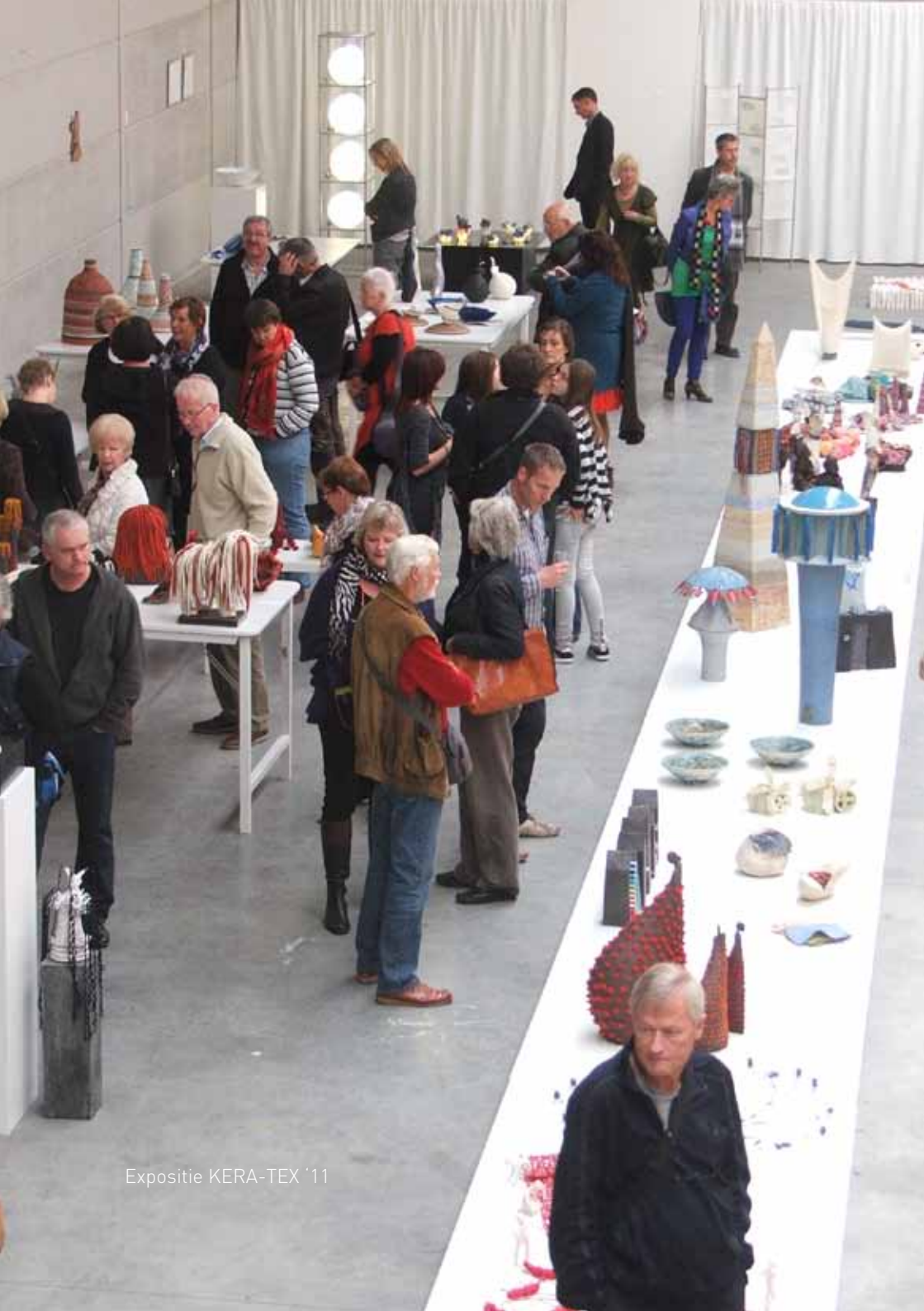
Expositie KERA-TEX '11

Verder is de wens aanwezig om in 2012 een kunstreis van een dag te organiseren.