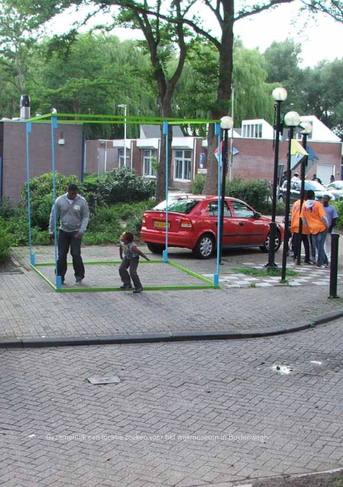
Gezamenlijk een locatie zoeken voor het wijkmuseum in Buytenwegh

technieken bewerken. Het thema van de foto's sloot aan bij het festival: de verborgen, geheimzinnige plekken van Zoetermeer.